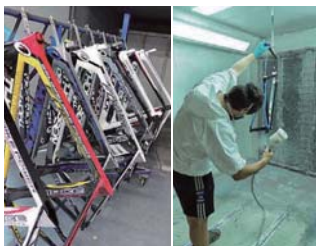
本国ベルギーにて行われる美しい塗装

通常のラインナップ同様、ピーククリエイティブも本国ベルギーの職人たちによって1本ずつ塗装されている。もちろんその後の組み付けも自社内で行なっており、製品へ対する徹底した品質管理と強いこだわりを感じることができる